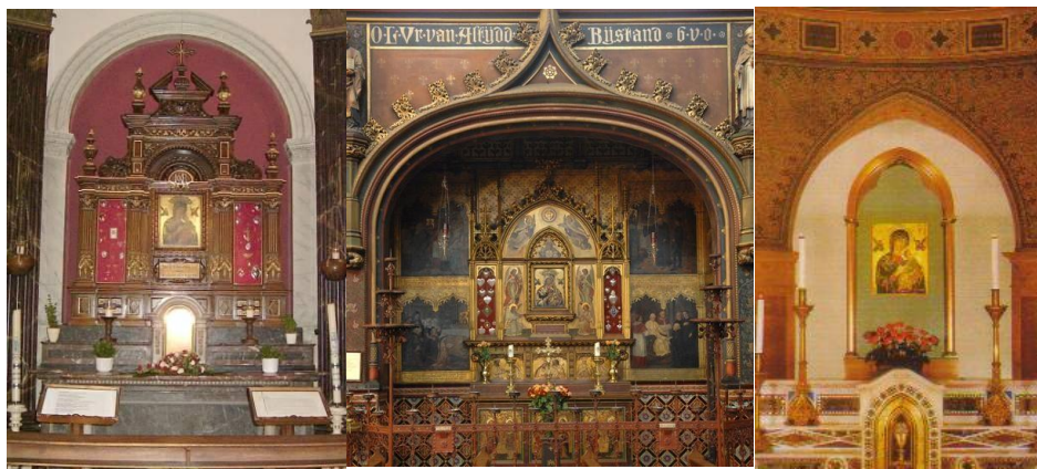
Van links naar rechts: de icon van OLV van Altijddurende Bijstand in Wittem, Amsterdam en de Alfonsuskerk in Rome.

Na de inwijding van de kerk waren de Redemptoristen ook in Amsterdam al snel succesvol. Zij voerden o.a. het gebruik in om een kerstkribbetje in de kerk te plaatsen (wat prompt door andere kerken in Amsterdam werd overgenomen) en vierden elk jaar plechtig de Meimaand (wat in die tijd evenmin in Amsterdam gebruikelijk was). Toen in 1866 paus Pius IX opdracht gaf om aan de icon van OLV van Altijddurende Bijstand bekendheid te geven, bleven de Amsterdamse redemptoristen weer niet achter. Zij brachten de icon in 1868 bij de opening van de meimaand voor het eerst in onze kerk. De icon werd gewoon aan de muur gehangen, maar dat was de toenmalige parochianen niet naar de zin. Zij bouwden voor haar een altaar en in 1886 werd op de feestdag van de H. Alfonsus (1 augustus) de huidige kapel ingewijd. Gezien de ex-foto's in de kapel, heeft OLV van Altijddurende Bijstand hun gebeden verhoord en nog steeds branden elke zondag kaarsen voor het Maria altaar.